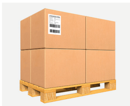
APL 60s 1 etiketa 10 palet/min.