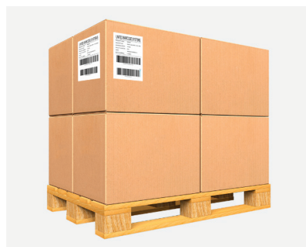
APL 60s 2 etikety 3 palety/min.