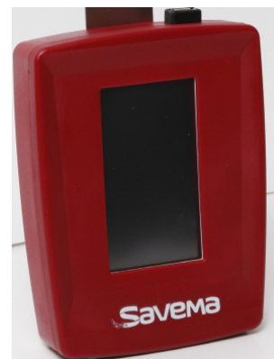
Řídicí jednotka 137 mm x 207 mm x 40