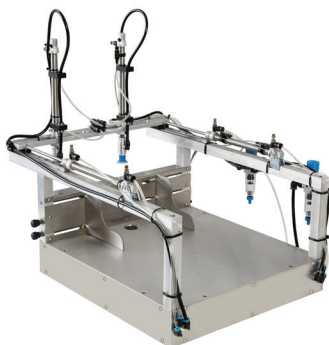
VAKUOVÝ PODAVAČ SVM A2