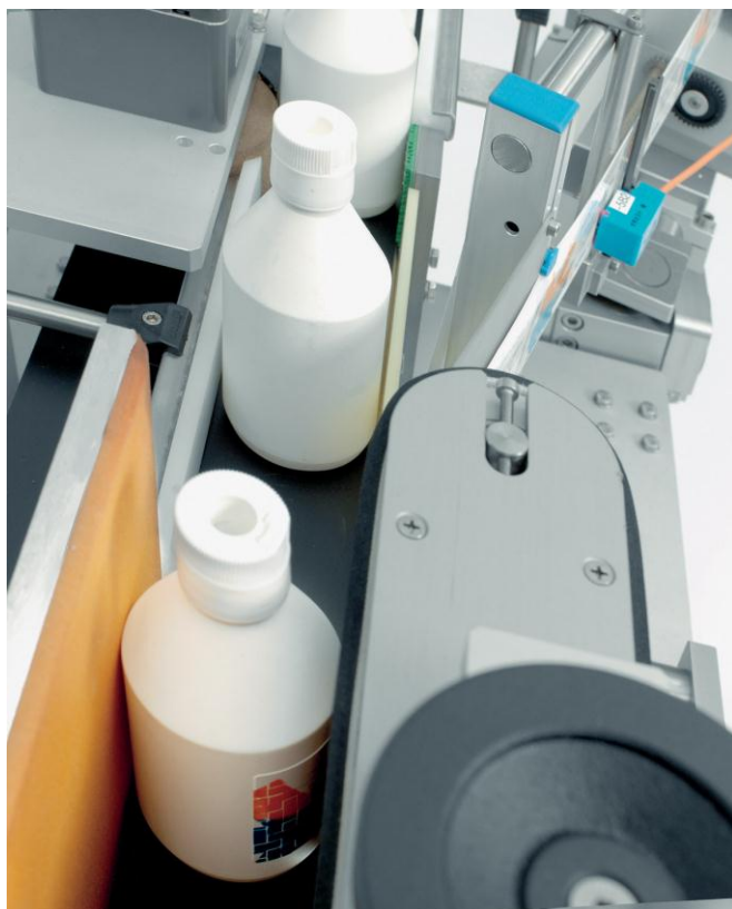
HERMA 152 C