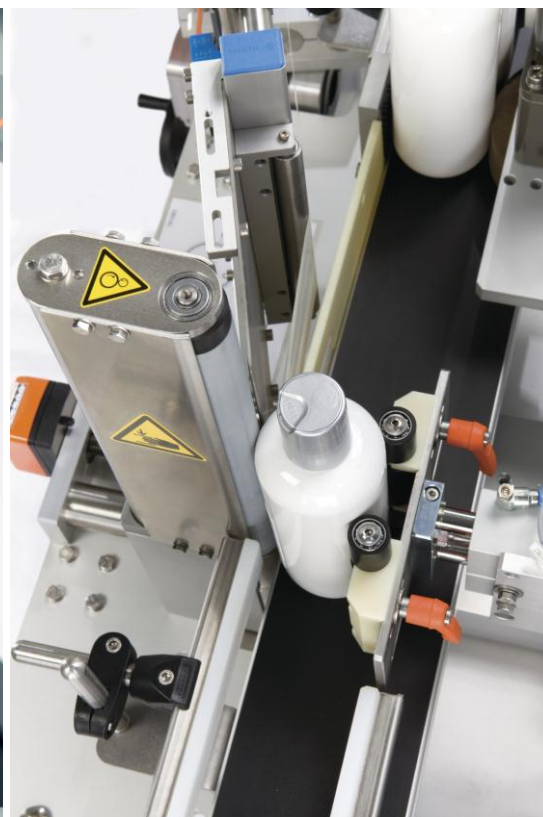
HERMA 152 C PRISMA