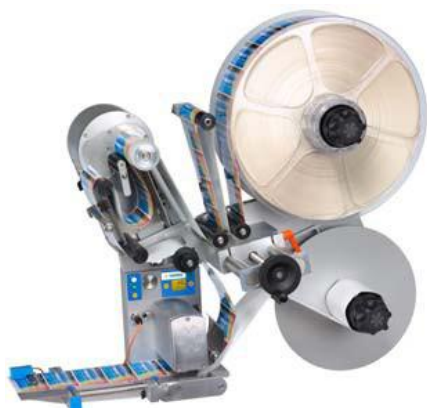
Motorizovaná konfigurace s motorizovaným navíječem pro velké kotouče etiket