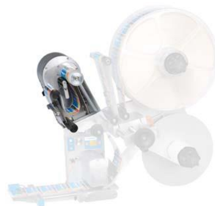
Smyčka motorizovaného odvíječe zvyšuje rychlost až na 150m/min