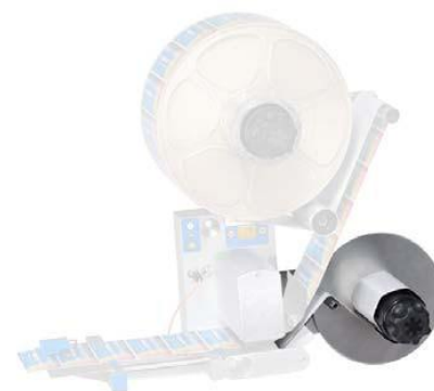
Navíječ nosného papíru s brzdou