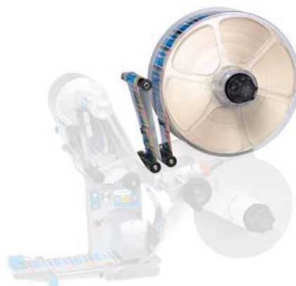
Motorizovaná odvíjení Ø kotouče 300/400 mm Šíře etiket 80/160/240/320 mm Rychlost do 80 m/min