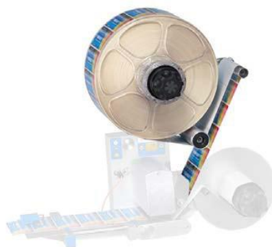
Standardní odvíjení s brzdou Ø kotouče 300/400 mm Šíře etiket 80/160/240 mm Rychlost do 40 m/min